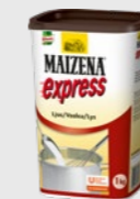
Express, lys jevner EPD 637264, 6 x 1 kg Gluten: nei/Laktose: ja