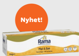
Rama Mat & Baking EPD 5977392, 10 x 1kg Gluten: nei/Laktose: ja