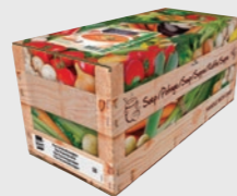
100% Thai Vegetable EPD 759662 10 kg (4x2,4l) Gluten: nei/Laktose: nei