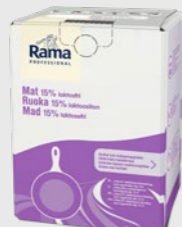
Mat 15% 10 l Laktosefri EPD 5362835, 10 l BiB Gluten: nei/Laktose: nei