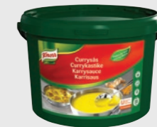
Karrisau EPD 2949733, 23l Gluten: nei/Laktose: <1g