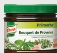
B. de Provence EPD 526194, 2x340g Gluten: nei/Laktose: nei