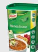
Minestronesuppe EPD 2601680, 3x 12l/1,2 kg Gluten: ja/Laktose: nei