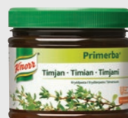
Timian EPD 391995, 2x340g Gluten: nei/Laktose: nei