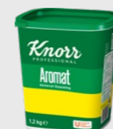
Aromat EPD 5692983, 1,2 kg Gluten: ja/Laktose: ja