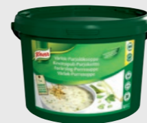
Vårløk og Purresuppe EPD 2601599, 30l /3kg Gluten: ja/Laktose: <0,5 g