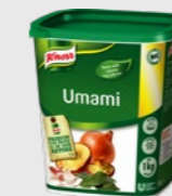
Umami EPD 2537405, 3x1 kg Gluten: nei/Laktose: nei