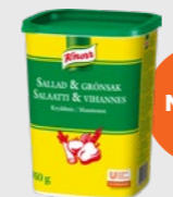
Salat & Grønnsaks- krydder EPD 5909015, 0,95 kg Gluten: nei/Laktose: nei