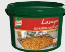
Lasagnesaus EPD 5109145, 40l(10gn) Gluten: nei/Laktose: nei**