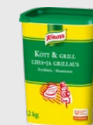
Kjøtt & Grill EPD 2543080, 3 x 1,2 kg Gluten: nei/Laktose: nei