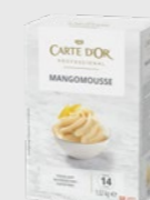
Mangomousse EPD 2630655, 14 l Gluten: nei/Laktose: ja