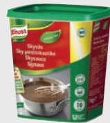
Sjysaus EPD 2280519, 3 x 10l Gluten: nei#/Laktose: nei