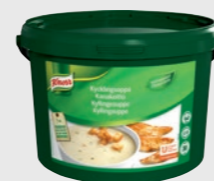
Kremet Kyllingsuppe EPD 2601664, 30l /3kg Gluten: ja/Laktose: <0,5 g