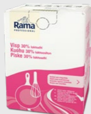
Piske 30% 10 l Laktosefri EPD 5362843, 10 l BiB Gluten: nei/Laktose: nei