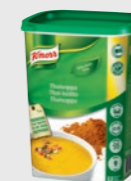
Thaisuppe EPD 2601698, 3x9l/0,9 kg Gluten: ja/Laktose: <0,5 g