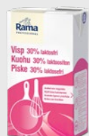
Piske 30% Laktosefri EPD 5362892, 8x1 l Gluten: nei/Laktose: nei

Rama Professional gir like god smak og kremet konsistens som tradisjonelle meieriprodukter. I tillegg får du høyere volum, lengre holdbarhet og mer for pengene.