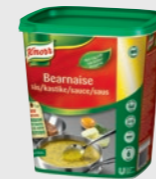
Bearnaisesaus EPD 2317436, 3 x 7l Gluten: nei/Laktose: <1g