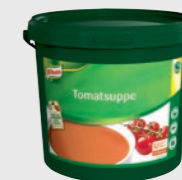
Tomatsuppe EPD 2624765, 40l (1x4kg) Gluten: ja/Laktose: nei