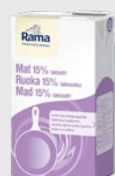
Mat 15% Laktosefri EPD 5362827, 8x1 Gluten: nei/Laktose: nei