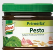
Pesto EPD 989376, 2x340g Gluten: nei/Laktose: nei