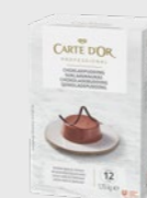
Sjokoladepudding EPD 2020717, 12l Gluten: nei/Laktose: nei*