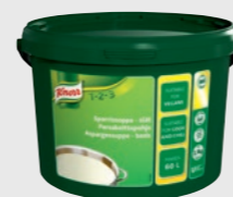
Aspargessuppe, basis EPD 2601573, 60 l (3,9kg) Gluten: nei/Laktose: nei