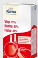
Piske 31% Lavlaktose EPD 5363601, 8x1 l Gluten: nei/Laktose: <1 g