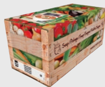
100% Goulash EPD 142034 10 kg (4x2,4l) Gluten: ja/Laktose: nei