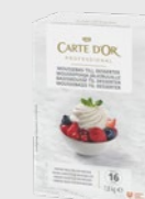
Moussebasis til desserter EPD 2020907, 16 l Gluten: nei/Laktose: ja