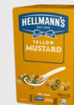
Sennep kuvert EPD 5728001, 198 x 10ml Gluten: nei/Laktose: nei