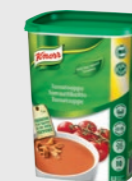
Tomatsuppe EPD 2601672, 3x 10l/1 kg Gluten: ja/Laktose: <0,5 g