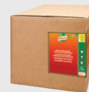
Cold Base Stivelse (kaldrørt jevning) EPD 5066840, 4 kg (2x2) Gluten: nei/Laktose: nei

Trenger man virkelig så mange ulike typer stivelse og jevninger på kjøkkenet? Svaret er selvfølgelig ja, fordi våre produkter har ulike egenskaper som hjelper deg å lykkes med ulike slags retter. Vil du lære mer om stivelse? Last ned guiden vår på ufs.com !