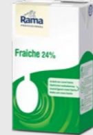
Fraiche 24% EPD 5362876, 8x1 l Gluten: nei/Laktose: ja