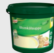
Blomkålsuppe EPD 2624716, 40l (1x4kg) Gluten: ja/Laktose: <0,5 g