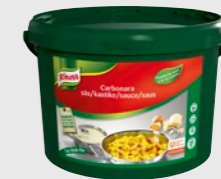
Carbonarasaus EPD 2294742, 27l Gluten: ja/Laktose: <1g*