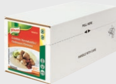
100% Fløtesaus EPD 1987031, 4 x 2,5l Gluten: nei/Laktose: <0,2 g