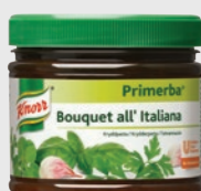
B. all'italiana EPD 568451, 2x340g Gluten: nei/Laktose: nei