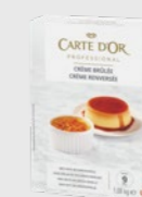
Crème Brûlée EPD 2631232, 9l(90 porsj) Gluten: nei/Laktose: nei*