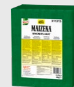
Snowflake EPD 684761, 4 kg Gluten: nei/Laktose: nei

Maizena Original er perfekt når du vil panere og fritere glutenfritt!