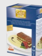
Vaniljesaus EPD 2021970, 11l Gluten: nei/Laktose: nei*