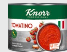
Tomatino tomatosaus EPD 4208229, 3 x 2kg Gluten: nei/Laktose: nei