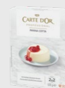
Panna Cotta EPD 2631067, 4l(40 porsj) Gluten: nei/Laktose: nei*