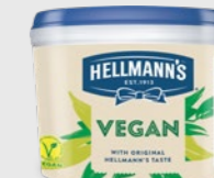
Majones Vegan EPD 5355532, 1x2,5kg Gluten: nei/Laktose: nei