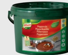
Peppersaus EPD 2296309, 30l Gluten: nei/Laktose: nei