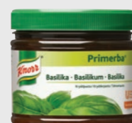
Basilikum EPD 526152, 2x340g Gluten: nei/Laktose: nei