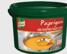
Papriganosaus EPD 5109723, 25l Gluten: nei/Laktose: nei