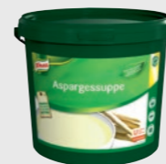
Aspargessuppe EPD 2624732, 40l (1x4kg) Gluten: nei/Laktose:<0,5 g