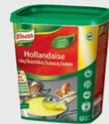
Hollandaisesaus EPD 2281962, 3 x 6l Gluten: nei#/Laktose: <1g*