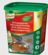
Grønn Peppersaus EPD 2281939, 3 x 8l Gluten: nei/Laktose: <0,01 g*