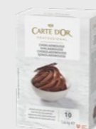
Sjokolademousse EPD 2630564, 10 l Gluten: nei/Laktose: ja