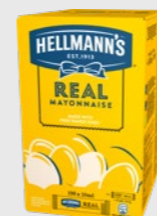
Real Majones kuvert EPD 5728480, 198 x 10ml Gluten: nei/Laktose: nei