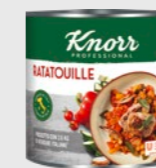
Ratatouille EPD 2884468, 6 x 2,5kg Gluten: nei/Laktose: nei