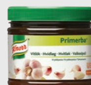
Hvitløk EPD 526186, 2x340g Gluten: nei/Laktose: nei