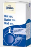
Mat 15% Lavlaktose EPD 5362884, 8x1 l Gluten: nei/Laktose: <1 g