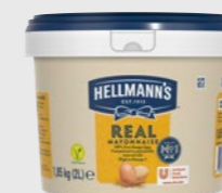
Majones Real EPD 5970645, 2kg Gluten: nei/Laktose: nei Erstatter EPD nr 2542850 i løpet av sommaren 2022