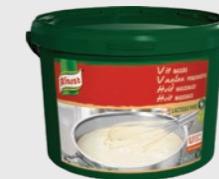
Hvit basissaus (uten melk) EPD 5110093, 50l Gluten: nei/Laktose: nei