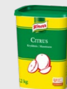
Citruskrydder EPD 5908991, 1,2 kg Gluten: nei/Laktose: nei