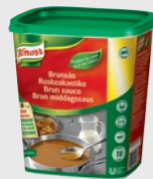
Brun Middagssaus EPD 2281905, 3 x 10l Gluten: nei#/Laktose: < 0,01 g*