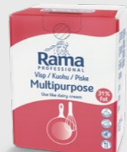
Piske 31% 10 l EPD 5741947, 10 l BiB Gluten: nei/Laktose: <1 g