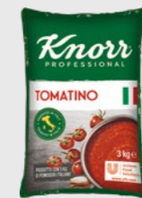
Tomatino EPD 5912738, 4 x 3 kg Gluten: nei/Laktose: nei