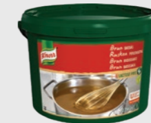
Brun basissaus EPD 5109111, 50l Gluten: nei/Laktose: nei