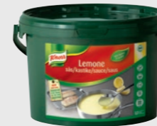
Sauce Lemone (Sitronsau) EPD 2295251, 22l Gluten: nei/Laktose: <1g*