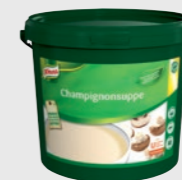
Champignonsuppe EPD 2624724, 40l (1x4kg) Gluten: ja/Laktose: <0,5 g