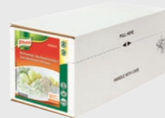
100% Hvit saus EPD 1986983, 4 x 2,5l Gluten: nei/Laktose: <0,2 g