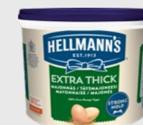
Majones Extra Thick EPD 2542868, 1x5kg Gluten: nei/Laktose: nei