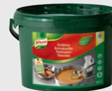
Fløtesaus EPD 2310258, 30l Gluten: nei/Laktose: <1g*