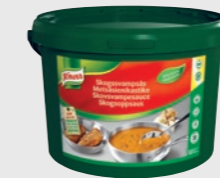
Skogsoppsaus EPD 2294957, 20l Gluten: nei/Laktose: ja

Tips! Tomatino har mange bruksområder som f.eks tomatbase, pasta eller pizzasaus.