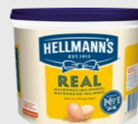
Majones Real EPD 2543106, 1x10kg Gluten: nei/Laktose: nei