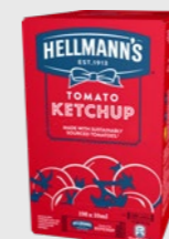
Ketchup kuvert EPD 5727995, 198 x 10ml Gluten: nei/Laktose: nei