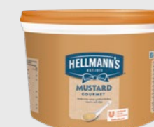
Sennep EPD 5808530, 1 x 3 kg Gluten: nei/Laktose: nei