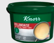
Hollandaisesaus EPD 5693015, 27l Gluten: nei/Laktose: <1g*