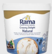
Creamy Delight Naturell EPD 5741962, 1,5 kg Gluten: nei/Laktose: ja