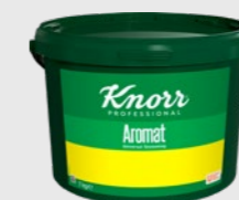
Aromat EPD 5692991, 7 kg Gluten: ja/Laktose: ja