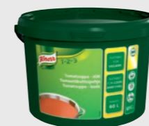
Tomatsuppe, basis EPD 2601565, 60l (3,9kg) Gluten: nei/Laktose: nei