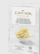
Hvit Sjokolademousse EPD 2630416, 13 l Gluten: nei/Laktose: ja