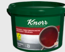
Rødløksaus EPD 5693510, 25l Gluten: nei/Laktose: nei