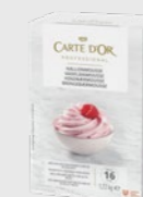
Bringbærmousse EPD 2020899, 16 l Gluten: nei/Laktose: ja