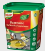
Bearnaisesaus EPD 2281921, 3 x 6l Gluten: nei#/Laktose: <1g*