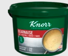
Bearnaisesaus EPD 5693536, 27l Gluten: nei/Laktose: <1g