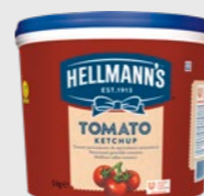
Ketchup EPD 5808506, 1 x 5 kg Gluten: nei/Laktose: nei