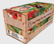
100% Roasted Pepper EPD 2280493 10 kg (4x2,4l) Gluten: nei/Laktose: ja