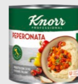
Peperonata EPD 4199543, 6 x 2,6kg Gluten: nei/Laktose: nei