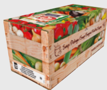
100% Roasted Pepper EPD 2280493 10 kg (4x2,4l) Gluten: nei/Laktose: ja