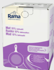
Mat 15% 10 l Laktosefri EPD 5362835, 10 l BiB Gluten: nei/Laktose: nei