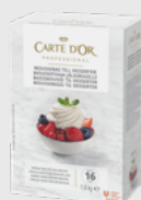
Moussebasis til desserter EPD 2020907, 16 l Gluten: nei/Laktose: ja