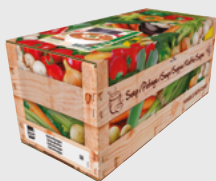
100% Goulash EPD 142034 10kg (4x2,4l) Gluten: ja/Laktose: nei