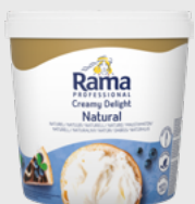
Creamy Delight Naturell EPD 5741962, 1,5 kg Gluten: nei/Laktose: ja