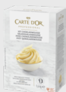
Hvit Sjokolademousse EPD 2630416, 13 l Gluten: nei/Laktose: ja