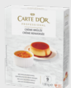
Crème Brûlée EPD 2631232, 9l(90 porsj) Gluten: nei/Laktose: nei*