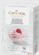
Bringbærmousse EPD 2020899, 14 l Gluten: nei/Laktose: ja