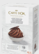
Sjokolademousse EPD 2630564, 10 l Gluten: nei/Laktose: ja