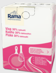
Piske 30% 10 l Laktosefri EPD 5362843, 10 l BiB Gluten: nei/Laktose: nei