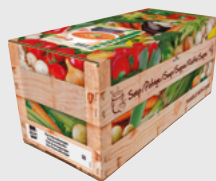
100% Thai Vegetable EPD 759662 10kg (4x2,4) Gluten: nei/Laktose: nei