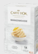
Mangomousse EPD 2630655, 14 l Gluten: nei/Laktose: ja