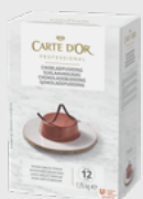
Sjokoladepudding EPD 2020717, 12l Gluten: nei/Laktose: nei*