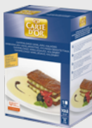
Vaniljesaus EPD 2021970, 11l Gluten: nei/Laktose: nei*