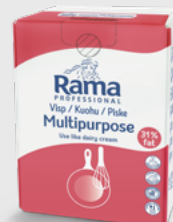
Piske 31% 10 l EPD 5741947, 10 l BiB Gluten: nei/Laktose: <1 g