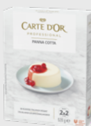
Panna Cotta EPD 2631067, 4l(40 porsj) Gluten: nei/Laktose: nei*